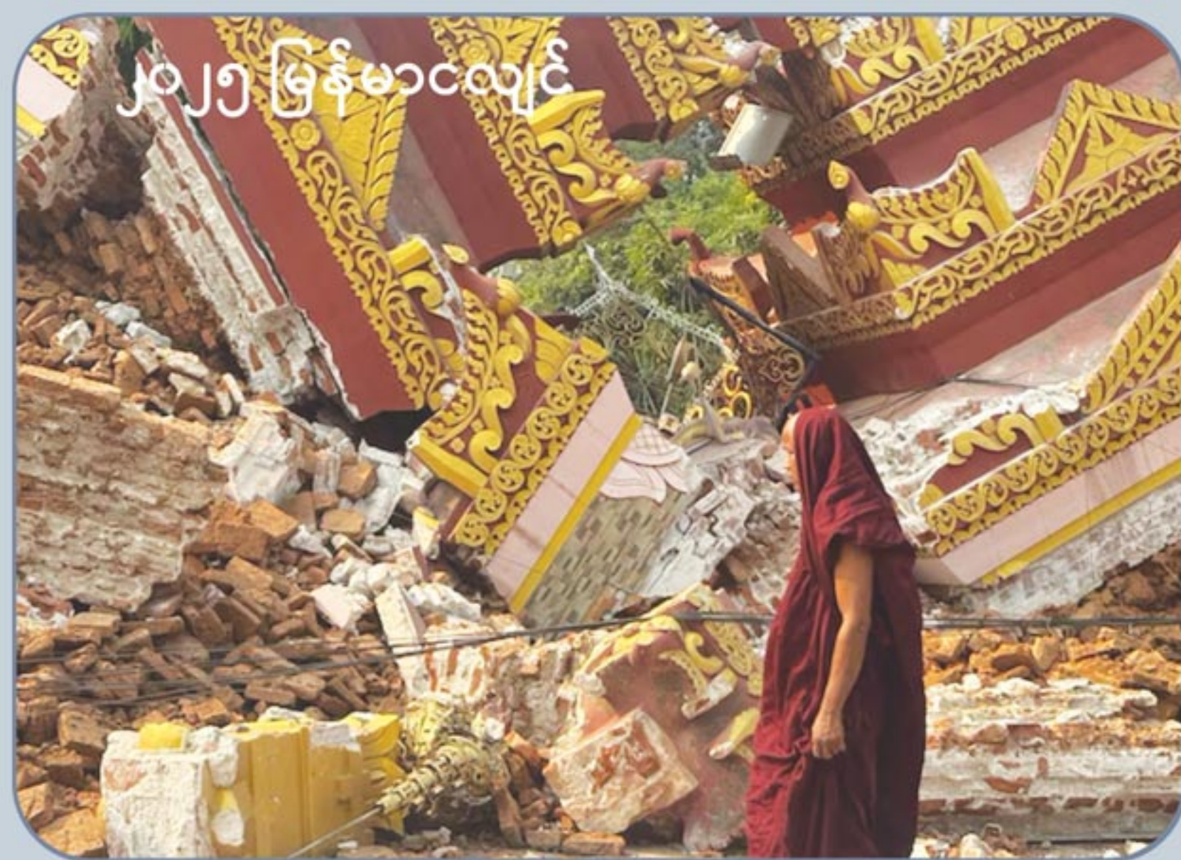
၂၀၂၅ မြန်မာ့လျှင်

၂၀၂၄ ရာဂီမုန်တိုင်းနှင့် ၂၀၂၅ မြေငလျင်လှုပ်ခတ်မှု သဘာဝဘေးနှစ်ရပ်လုံးသည် အလွန်ပြင်းထန်သော်လည်း၊ ထိခိုက်ပျက်စီးမှုအခြေအနေတို့တွင် သိသာထင်ရှားစွာကွဲပြားလျက်ရှိပါသည်။ ရစ်ချ်တာစကေး (၇.၇) ရှိ အလွန်ပြင်းထန်သည့် ငလျင်ကြောင့် အဆောက်အဦများစွာ ထိခိုက်ပျက်စီးမှုကြီးမားစေခဲ့ပြီး လူပေါင်း (၃,၇၀၀) ကျော် သေဆုံးကာ လူပေါင်းထောင်ချီထိခိုက်ဒဏ်ရာရရှိခဲ့သည့်အပြင် မိသားစုအများအပြား အိုးမဲ့အိမ်မဲ့ ဖြစ်ခဲ့ရသည်။ ယင်းနှင့်နှိုင်းယှဉ်လျှင် ၂၀၂၄ ခုနှစ်က တိုက်ခတ်ခဲ့သည့် ရာဂီမုန်တိုင်းသည် ရေကြီးမှုများ၊ မြေပြိုမှုများကို ဖြစ်စေပြီး လူပေါင်း (၆၃၀,၀၀၀) ကျော်နေရပ်စွန့်ခွာခဲ့ရသည်။ အသက်ဆုံးရှုံးမှုနှုန်းကိုနှိုင်းယှဉ်ပါက နည်းပါးသော်လည်း၊ မုန်တိုင်းသည်စိုက်ပျိုးရေးနှင့်ကျေးလက်ဒေသဖွံ့ဖြိုးရေးအပေါ် ပြင်းထန်စွာထိခိုက်ခဲ့ပါသည်။ ယင်းသို့မတူကွဲပြားသည့် အတွေ့အကြုံများသည် မြန်မာနိုင်ငံအနေဖြင့် ရင်ဆိုင်နေရသည့်သဘာဝဘေး အန္တရာယ်အမျိုးမျိုးနှင့် သဘာဝဘေးဖြစ်ပွားမှုအလိုက်သင့်လျော်သော ကြိုတင်ပြင်ဆင်မှုမဟာဗျူဟာ လိုအပ်နေကြောင်း ကိုလည်း မီးမောင်းထိုးပြလျက်ရှိပါသည်။