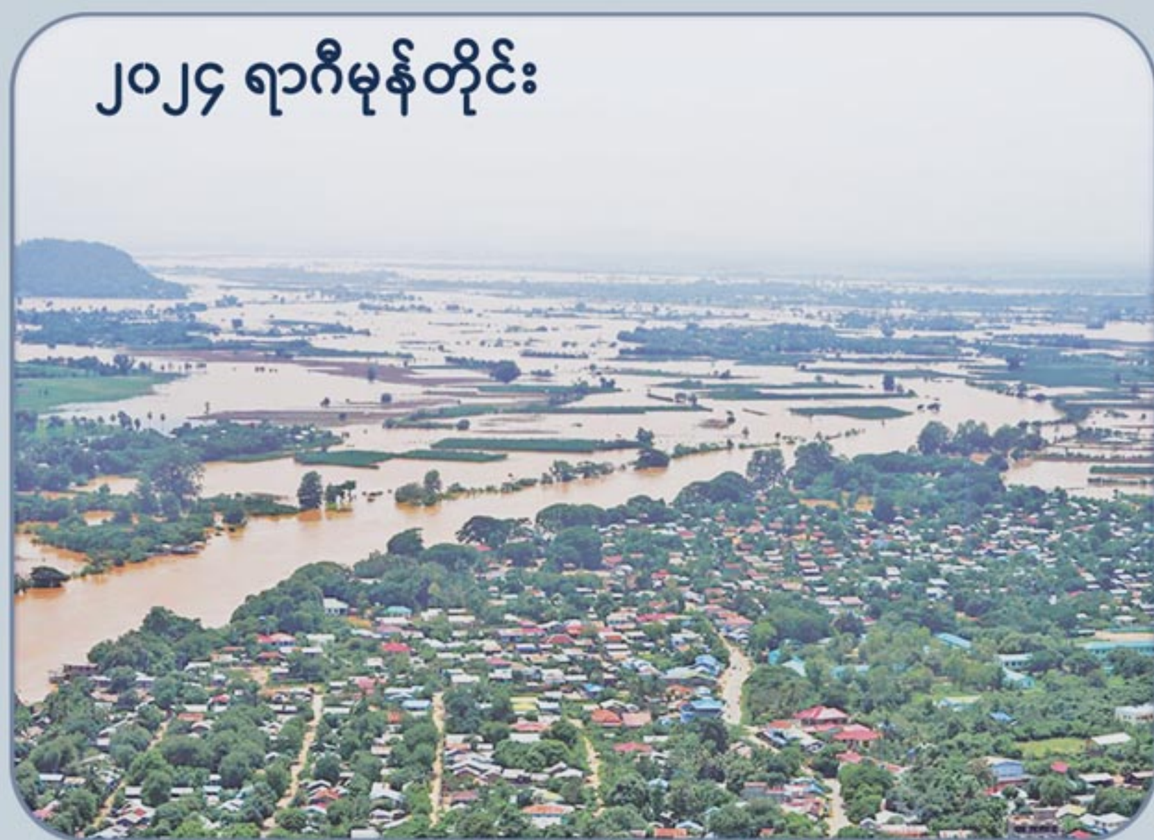
၂၀၂၄ ရာဂီမုန်တိုင်း