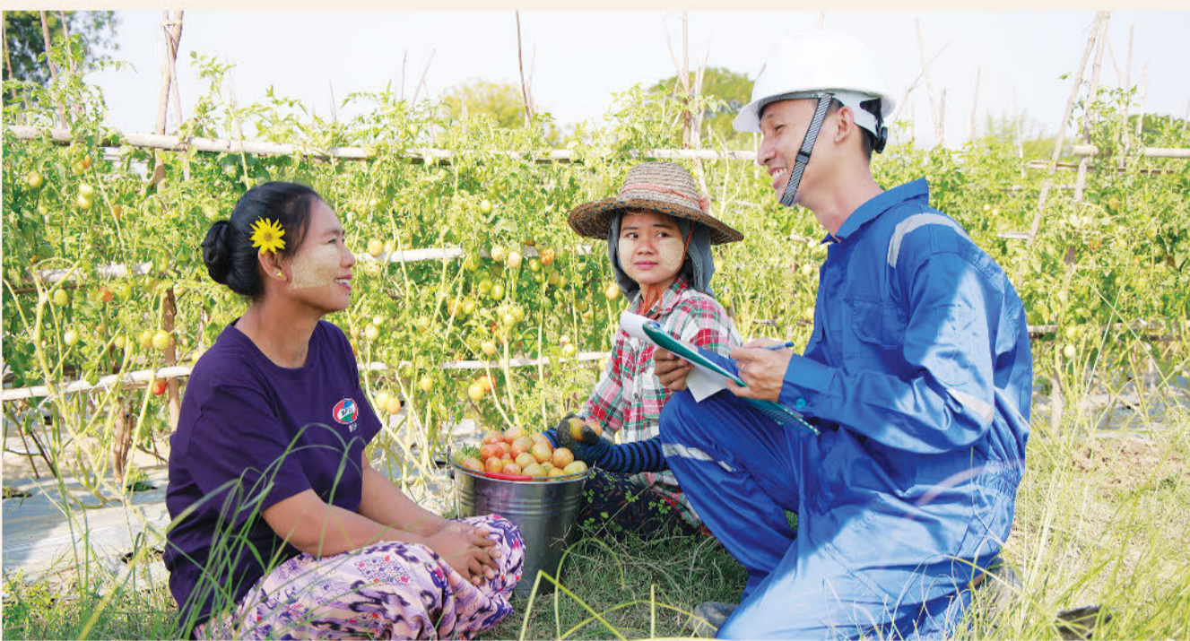
ဆရာမ အနားမှာရှိနေတာက ဘာနဲ့မှမတူအောင် အားကိုးအားထားပြုရတော့ ဆေးခန်းလေးလည်း အမြဲရှိစေချင်ပါတယ်။ ကုမ္ပဏီလည်း ဒီထက်မက ကြီးပွားတိုးတက်ပါစေလို့ အမြဲဆုတောင်းပေးပါတယ်။

မြန်မာ့ရေနံနှင့်သဘာဝဓာတ်ငွေ့လုပ်ငန်းနှင့် ပူးပေါင်း၍ မန်းရေနံမြေတွင် ရေနံတူးဖော်ထုတ်လုပ်ရေးလုပ်ငန်းများကို လုပ်ကိုင်ဆောင်ရွက်လျက်ရှိသည့် MPRL E&P အနေနဲ့ ဒေသဖွံ့ဖြိုးတိုးတက်ရေးလုပ်ငန်းများနှင့်အတူ မန်းရေနံမြေဒေသခံများအတွက် ကျန်းမာရေး၊ ပညာရေး၊ အသက်မွေးဝမ်းကျောင်း ဖွံ့ဖြိုးတိုးတက်ရေး စသည့်ကဏ္ဍအလိုက် လူမှုတာဝန်သိ CSR လုပ်ငန်းများကိုဆောင်ရွက်ခဲ့သည်မှာ ဆယ်စုနှစ်တစ်ခုကြာကာလသို့ ရောက်ရှိခဲ့ပြီဖြစ်သည်။ ထို့ပြင် မန်းရေနံမြေစီမံခန့်ခွဲရေးလုပ်ငန်းများကို သက်ဆိုင်ရာအဖွဲ့အစည်းများနှင့်ပူးပေါင်း၍ ဆက်လက်လုပ်ကိုင်ဆောင်ရွက်ခွင့်ရရှိခဲ့သည့် MPRL E&P ကုမ္ပဏီအနေဖြင့် ကုမ္ပဏီ၏ လူမှုတာဝန်သိ CSR လုပ်ငန်းများကိုပါ အရှိန်အဟုန်မပြတ် ဆက်လက်လုပ်ကိုင်ဆောင်ရွက်သွားမည်ဖြစ်သည်။ သို့ဖြစ်၍ မန်းရေနံမြေတွင် ပံ့ပိုးဆောင်ရွက်ခဲ့သည့် လူမှုတာဝန်သိ CSR လုပ်ငန်း ကဏ္ဍအလိုက် အကျိုးခံစားခွင့်ရရှိခဲ့သည့်ဒေသခံများ၏ ကုမ္ပဏီနှင့် CSR လုပ်ငန်းများအပေါ် သဘောထားမှတ်ချက်များကိုသိရှိနိုင်ရန် တို့မန်းမြေသတင်းအယ်ဒီတာအဖွဲ့က သွားရောက်တွေ့ဆုံမေးမြန်းခဲ့သည်များကို တင်ပြအပ်ပါသည်။