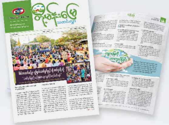
တို့မန်းမြေ သတင်းလွှာ အမှတ် (၁၆) ထုတ်ဝေဖြန့်ချိခြင်း

ထို့ပြင် MPRL E&P သည် သတ်မှတ်ဘဏ္ဍာရေးနှစ်များအတွင်း အပတ်စဉ်၊ လစဉ်၊ သုံးလပတ်နှင့် ခြောက်လပတ် အစီရင်ခံစာများကို ပုံမှန်ရေးသားထုတ်ဝေလျက်ရှိပြီး ၂၀၂၄-၂၀၂၅ ဘဏ္ဍာရေးနှစ်၊ စတုတ္ထသုံးလပတ်အတွင်း