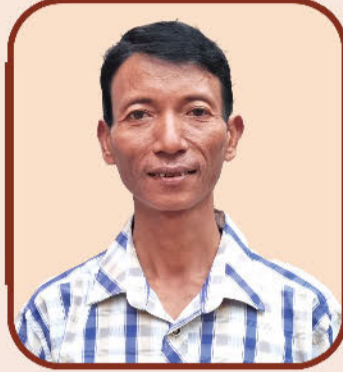
ဦးမင်းစိုးဦး သင်တန်းသူမိဘ မန်းကျီးကျေးရွာ