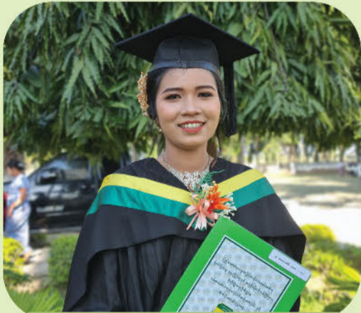
မဝေဝေလင်း

မန်းရေနံမြေဒေသခံလူငယ်များအတွက် အလုပ်အကိုင်အခွင့်အလမ်းများ တိုးတက်ရရှိစေရေးနှင့် တစ်နိုင်တပိုင် စီးပွားရေးလုပ်ငန်းများ လုပ်ကိုင်ဆောင်ရွက်နိုင်စေရန် ရည်ရွယ်၍ MPRL E&P ကုမ္ပဏီ၏ CSR အစီအစဉ်သည် ဒေသခံလူငယ်များအား ပညာသင်ဆုထောက်ပံ့သည့်အစီအစဉ်ကို ၂၀၁၉ ခုနှစ်တွင် စတင်ခဲ့သည်။ အဆိုပါ အစီအစဉ်အရ ၂၀၂၂-၂၀၂၃ ဘဏ္ဍာရေးနှစ်တွင် MPRL E&P ကုမ္ပဏီ၏ ပညာသင်ဆုပံ့ပိုးမှုဖြင့် မန်းရေနံမြေဒေသမှ ကျောင်းသား (၄) ဦးနှင့် ကျောင်းသူ (၃) ဦးတို့ သည် စိုက်ပျိုးရေးနှင့်မြေယာရေးရာသိပ္ပံ (ပွင့်ဖြူ) တွင် စိုက်ပျိုးရေးပညာရပ်များကို သုံးနှစ်တာ လေ့လာသင်ယူခွင့်ရရှိခဲ့ပြီး ၂၀၂၅ ခုနှစ်၊ ဇန်နဝါရီလ (၁၀) ရက်နေ့ တွင် စိုက်ပျိုးရေးဒီပလိုမာအောင်လက်မှတ်များ ရရှိခဲ့ကြသည်။ MPRL E&P ကုမ္ပဏီ၏ ပညာသင်ဆုပံ့ပိုးခဲ့သည့် မန်းရေနံမြေဒေသခံလူငယ် (၇) ဦး၏ ကျောင်းသား ဘဝ အတွေ့အကြုံများ၊ ဒီပလိုမာအောင်လက်မှတ် ရရှိပြီးနောက် အနာဂတ်အတွက် ပြင်ဆင်ဆောင်ရွက်နေမှုများကို တို့မန်းမြေသတင်းစာသို့ ယခုကဲ့သို့ မျှဝေခဲ့ကြသည်။