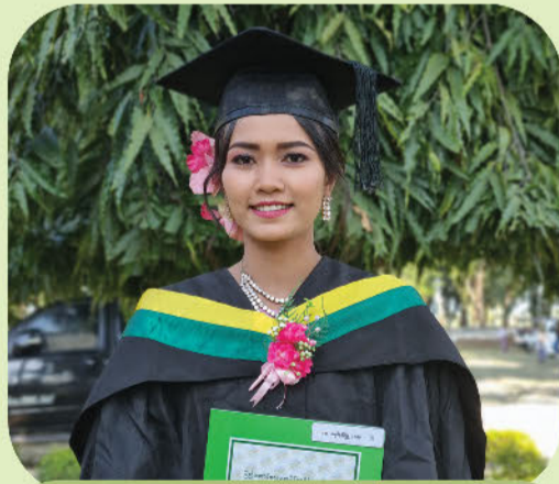
မချစ်နှင်းဖြူ

တက်ကြမယ့် မန်းရေနံမြေက ဂျူနီယာတွေအနေနဲ့လည်း ပညာကို ကြိုးစားသင်ယူကြပါ။ ရလာတဲ့ ပညာသင်ဆုကို လည်း တန်ဖိုးထားကြပါလို့ တိုက်တွန်းချင်ပါတယ်။ ပညာ သင်ဆုက ကိုယ့်ဘဝကို ပိုပြီးတောက်ပစေမယ့် ပံ့ပိုးမှု တစ်ခုလို့ ယုံကြည်ပါတယ်။