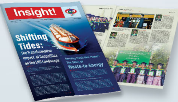
Insight! သတင်းလွှာ အမှတ် (၄၂) ထုတ်ဝေဖြန့်ချိခြင်း

များက သွားရောက်ပေးပို့ခဲ့သည်။ ထို့ပြင် မန်းရေနံမြေတွင် ကုမ္ပဏီ၏ CSR လုပ်ငန်းဆောင်ရွက်ချက်များကို ပူးပေါင်းပါဝင်ဆောင်ရွက်ကြသည့် ကျေးရွာအုပ်ချုပ်ရေးမှူးများနှင့် ဒေသခံစေတနာ့ဝန်ထမ်းများကိုလည်း နှစ်သစ်လက်ဆောင်အဖြစ် ပုဆိုးနှင့်လုံခြုံခြည်များကို CSR လုပ်ငန်းအဖွဲ့ဝင်များက ပေးအပ်ခဲ့သည်။ ■