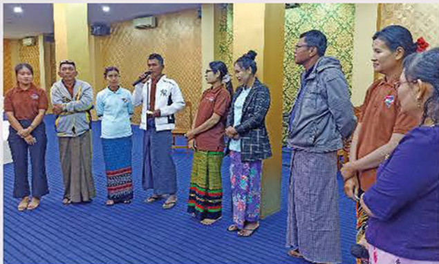
စာတွေ့လက်တွေ့လေ့ကျင့်ခန်းများ၊ ဂိမ်းအစီအစဉ်များဖြင့်ပို့ချခဲ့သည်။

“ဒီနေ့သင်တန်းက စွမ်းဆောင်မှုနဲ့တိုးတက်မှုခရီးစဉ်ကို စတင်တဲ့ ထင်ရှားတဲ့မှတ်တိုင်တစ်ခုပါ။ လူမှုရေးနဲ့ရပ်ရွာဖွံ့ဖြိုးတိုးတက်ရေးကိုအဓိကထားတဲ့ MPRL E&P ကုမ္ပဏီရဲ့ (CSR အစီအစဉ်)ရဲ့ အရေးပါတဲ့ ကဏ္ဍတစ်ခုအနေနဲ့ ဒီသင်တန်းကို ပံ့ပိုးပို့ချခွင့်ရတာလည်း ဂုဏ်ယူဝမ်းမြောက်ပါတယ်။ ဒီသင်တန်းကနေ သက်ဆိုင်ရာဒေသခံအစုအဖွဲ့တွေအနေနဲ့ ကျွမ်းကျင်မှု၊ အသိပညာနဲ့ ထိုးထွင်းသိမြင်မှုတွေကို ပံ့ပိုးပျိုးထောင်ပြီး အကျိုးရလဒ်ကောင်းတွေကို ရရှိစေမှာ ဖြစ်ပါတယ်” ဟု သင်တန်းပို့ချခဲ့သည့် The Art of Facilitation ၏ လူမှုမီဒီယာစာမျက်နှာတွင် ဖော်ပြခဲ့သည်။