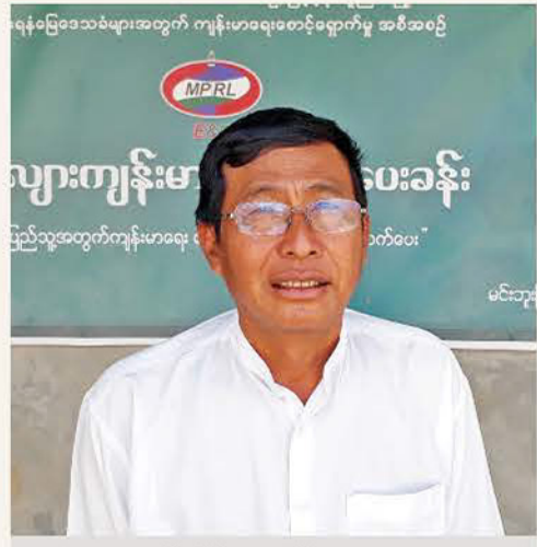
ဦးစိန်သောင်းထွေး လေးအိမ်တန်းကျေးရွာ

မန်းရေနံမြေဒေသခံတို့၏ CSR လုပ်ငန်းဆိုင်ရာ မျှဝေစကားသံများ