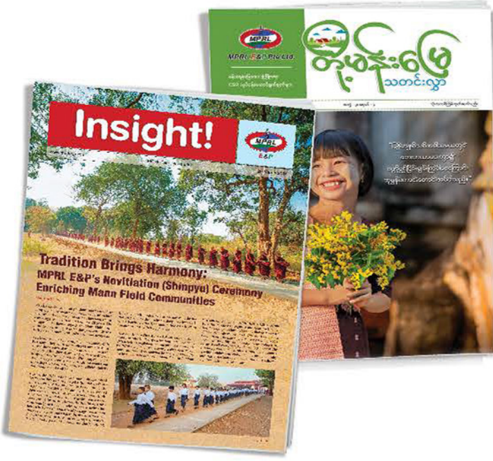
Insight! သတင်းလွှာ အမှတ် (၃၈) နှင့် တို့မန်းမြေ သတင်းလွှာ အမှတ် (၁၂) ထုတ်ဝေဖြန့်ချိခြင်း

MPRL E&P ကုမ္ပဏီအနေဖြင့် မန်းရေန်မြေတွင် အကောင်အထည်ဖော်လျက်ရှိသည့် သတ်မှတ်ဘဏ္ဍာရေးနှစ်နှင့် သုံးလပတ်ကာလအလိုက် လုပ်ငန်းဆောင်ရွက်ချက်များ သီးသန့် စုစည်းဖော်ပြထားသည့် “တို့မန်းမြေ” သတင်းလွှာ၊ အမှတ် (၁၂) ကို ၂၀၂၄ ခုနှစ်၊ မတ်လအတွင်း ထုတ်ဝေခဲ့သည်။