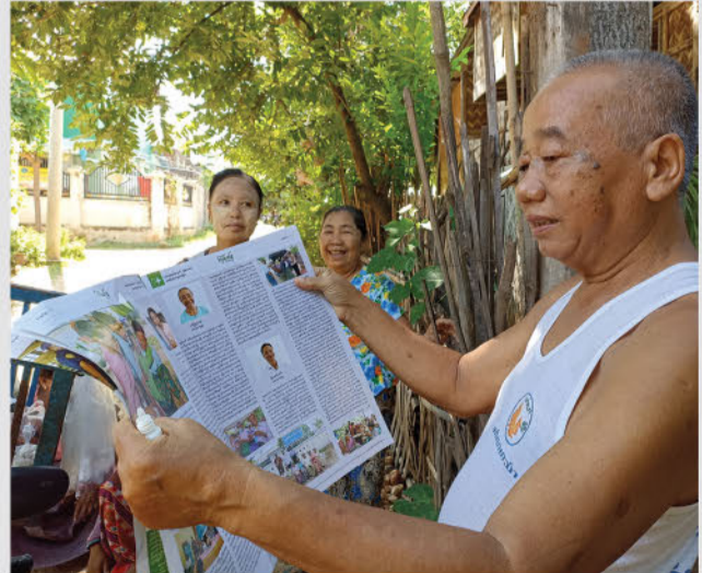
ထုတ်ဝေပြီး စာစောင်များနှင့် အစီရင်ခံစာများကို သက်ဆိုင်ရာလုပ်ငန်းဆက်စပ်လုပ်ကိုင်သူများထံ ဖြန့်ချိခြင်း