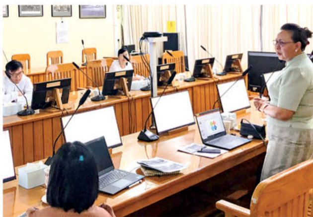
၂၀၂၃-၂၀၂၄ ဘဏ္ဍာရေးနှစ်၊ ပထမခြောက်လပတ်အတွင်းဆောင်ရွက်ခဲ့သည့် CSR လုပ်ငန်းများကို မြန်မာ့ရေနံနှင့်သဘာဝဓာတ်ငွေ့လုပ်ငန်း (နေပြည်တော်) ရှိ တာဝန်ရှိသူများအား ရှင်းလင်းတင်ပြခြင်း