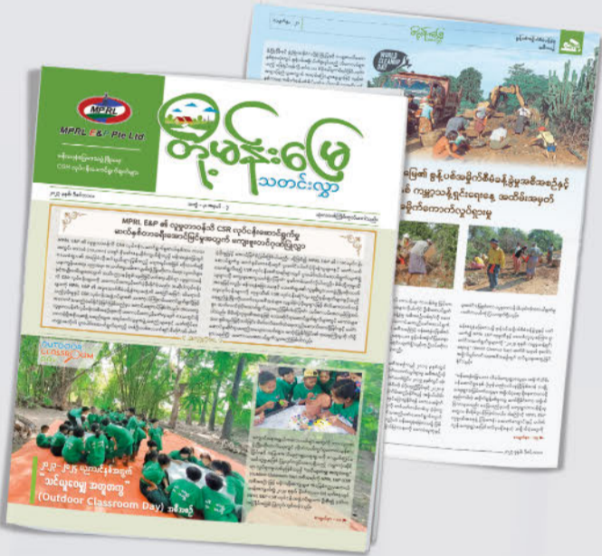
တိုးတက်ရေး သတင်းစာ အမှတ် (၁၁) ထုတ်ဝေဖြန့်ချိခြင်း

MPRL E&P ၏ မန်းရေနံမြေတွင်ဆောင်ရွက်လျက်ရှိသည့် CSR လုပ်ငန်းများနှင့် စပ်လျဉ်း၍ လစဉ်၊ သုံးလတစ်ကြိမ်၊ ခြောက်လတစ်ကြိမ်နှင့် နှစ်ပတ်လည်အစီရင်ခံစာများဖြင့် သက်ဆိုင်ရာလုပ်ငန်း ဆက်စပ်လုပ်ကိုင်သူများထံသို့ ပေးပို့အစီရင်ခံလျက်ရှိရာ ၂၀၂၃-၂၀၂၄ ဘဏ္ဍာရေးနှစ်၊ တတိယသုံးလပတ်အတွင်း CSR လုပ်ငန်းဆောင်ရွက်ချက်ဆိုင်ရာ အစီရင်ခံစာကို ထုတ်ဝေခဲ့ပြီး မကွေးတိုင်းဒေသကြီးအစိုးရအဖွဲ့နှင့် သက်ဆိုင်ရာလုပ်ငန်းဆက်စပ်လုပ်ကိုင်သူများထံ ပေးပို့ခဲ့သည်။ ထို့အပြင် မြန်မာ-အင်္ဂလိပ် နှစ်ဘာသာဖြင့် ရေးသားဖော်ပြထားသည့် အကြံပြုဆွေးနွေးခြင်းလုပ်ငန်းစဉ်ဆိုင်ရာ ဒုတိယသုံးလပတ်အစီရင်ခံစာကို MPRL E&P ၏ ဝက်ဘ်ဆိုဒ်စာမျက်နှာ https://mprlexp.com/ တွင် အခြားထုတ်ဝေပြီး သတင်းလွှာများနှင့်အတူ တင်ပြအစီရင်ခံခဲ့ပြီးဖြစ်သည်။ ■