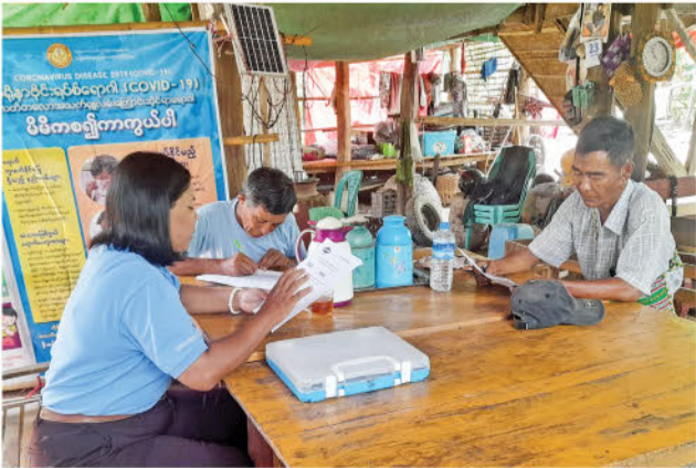
၂၀၂၄-၂၀၂၅ ဘဏ္ဍာရေးနှစ်တွင် ဆောင်ရွက်နိုင်မည့် CSR လုပ်ငန်းအစီအစဉ်များကို သတ်မှတ်ဖော်ထုတ်နိုင်ရန် မန်းရေနံမြေဒေသခံများ၏ လိုလားချက်များကို အကြံစစ်တမ်းကောက်ယူခြင်း