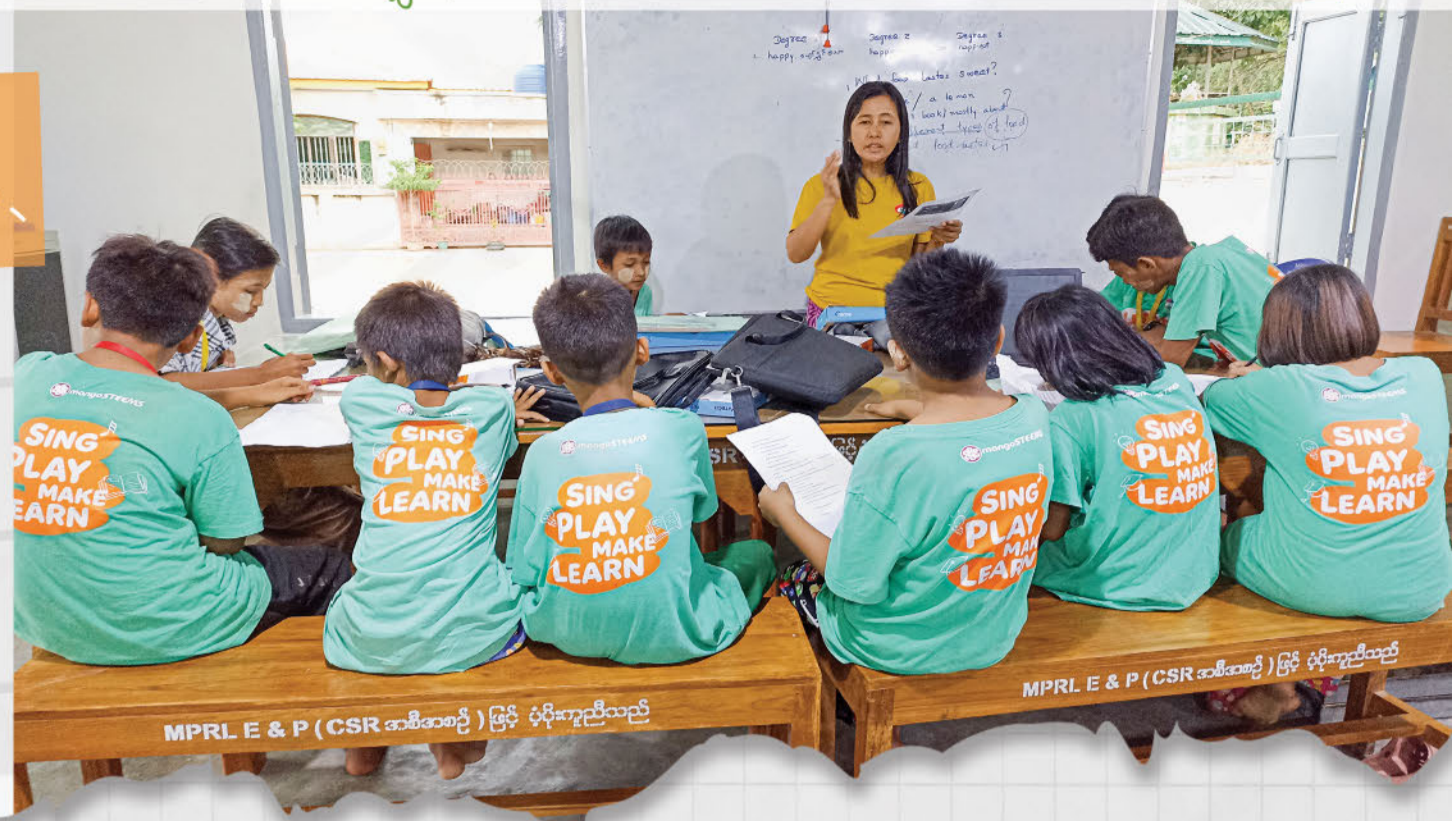
MPRL E & P (CSR အစီအစဉ်) မြှင့် ပံ့ပိုးကူညီသည်

အင်္ဂလိပ်ဘာသာစကားသင်ယူခြင်း၏ တစ်သက်တာ အကျိုးကျေးဇူးများ