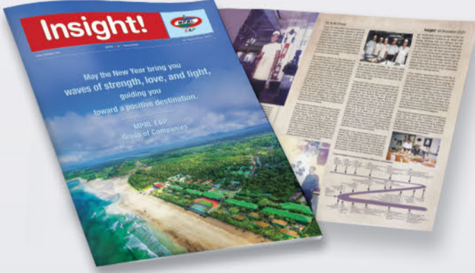
Insight! သတင်းစာ အမှတ် (၃၇) ထုတ်ဝေဖြန့်ချိခြင်း

MPRL E&P ကုမ္ပဏီအနေဖြင့် မန်းရေနံမြေတွင် အကောင်အထည်ဖော်လျက်ရှိသည့် သတ်မှတ်ဘဏ္ဍာရေးနှစ်နှင့် သုံးလပတ် ကာလအလိုက် လုပ်ငန်းဆောင်ရွက်ချက်များ သီးသန့်စုစည်းဖော်ပြထားသည့် “တိုးတက်ရေး” သတင်းစာ၊ အမှတ် (၁၁) ကို ၂၀၂၃ ခုနှစ်၊ ဒီဇင်ဘာလအတွင်း ထုတ်ဝေခဲ့သည်။ တိုးတက်ရေး သတင်းစာ အမှတ် (၁၁) တွင် ၂၀၂၂ ခုနှစ်ကတည်းက စတင်ဆောင်ရွက်ခဲ့သည့် MPRL E&P ၏ မန်းရေနံမြေဆိုင်ရာ လူမှုတာဝန်သိလုပ်ငန်းများကဏ္ဍ ဆယ်နှစ်တာခရီးအောင်မြင်မှုအတွက် ကျေးဇူးတင်လွှာနှင့် ဆယ်နှစ်ပြည့် အထိမ်းအမှတ်အဖြစ် “A Decade of Action: CSR Then and Now” အစီရင်ခံစာထုတ်ဝေမှုတို့ကို ဖော်ပြထားသည်။ ထို့အပြင် တိုးတက်ရေးသတင်းစာတွင် ကျေးရွာအခြေခံအဆောက်အအုံဖွံ့ဖြိုးရေးလုပ်ငန်းများ၊ ဒေသခံများ၏ အသက်မွေးဝမ်းကျောင်းဖွံ့ဖြိုးရေးဆိုင်ရာ စိုက်ပျိုးရေးလုပ်ငန်းများ၊ ပညာရေးဆိုင်ရာပူးပေါင်းဆောင်ရွက်မှုနှင့် စွမ်းရည်ဖွံ့ဖြိုးရေးလုပ်ငန်းများ၊ အခမဲ့ ကျန်းမာရေးစောင့်ရှောက်မှုအစီအစဉ်၊ အကြံပြုဆွေးနွေးခြင်းလုပ်ငန်းစဉ်၊ ဒေသခံများ ဦးဆောင်သည့် စွန့်ပစ်အမှိုက်စီမံခန့်ခွဲရေးလုပ်ငန်းများနှင့် ပြန်ကြားဆက်သွယ်ရေးလုပ်ငန်းအစီအစဉ်များလည်း ဖော်ပြပါရှိသည်။