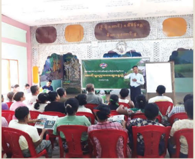
စပ်လျဉ်းသည့် တောင်သူပညာပေးဆွေးနွေးပွဲကို မယ်ဘောကုန်းကျေးရွာ ဓမ္မာရုံတွင် ပြုလုပ်ခဲ့သည်။

အလားတူ ၂၀၂၃ ခုနှစ်၊ အောက်တိုဘာလအတွင်း အောက်ကျောင်းနှင့် မယ်ဘောကုန်းကျေးရွာတို့ရှိ ကုလားပဲနှင့် နေကြာစိုက်တောင်သူ (၆၀) ဦးအတွက် ရေတံခွန်စိုက်ပျိုးရေးဝန်ဆောင်မှုအဖွဲ့၏အကူအညီဖြင့် စိုက်ပျိုးရေးဆိုင်ရာ ပိုးမွှားထိန်းချုပ်မှုနှင့် အပင်ရောဂါအမျိုးမျိုးတို့နှင့်